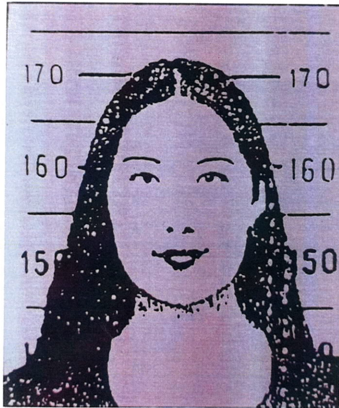
ภาพถ่ายในระบบคอมพิวเตอร์

(เอกสารแนบท้ายหนังสือกรมการปกครอง ด่วนที่สุด ที่ มท ๐๓๐๙.๒/ว ๒๙๕๓๙ ลงวันที่ ๑ พฤศจิกายน ๒๕๖๒) ตัวอย่างภาพถ่ายในบัตรประจำตัวประชาชน